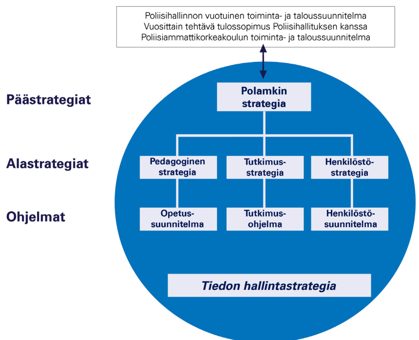
Kuvio 1. Oppilaitoksen strategiat (kuviossa tiedon hallintastrategian ala on kuvattu sinisellä).

Oppilaitoksen keskeisten strategioiden kokonaisuus on esitetty seuraavassa kuviossa: