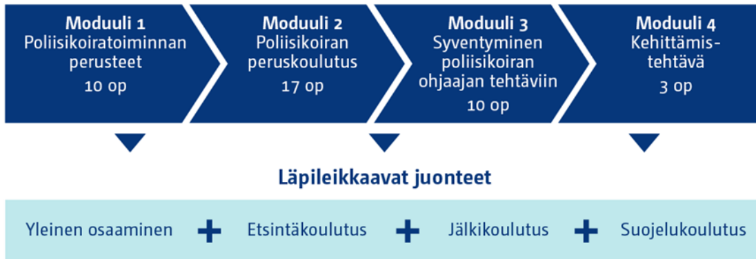
Kuva 1 Partiokoiranohjaajan erikoistumisopinnot (40 op).

Opintoihin sisältyy kehittämistehtävä, joka aloitetaan moduuli 2 aikana.